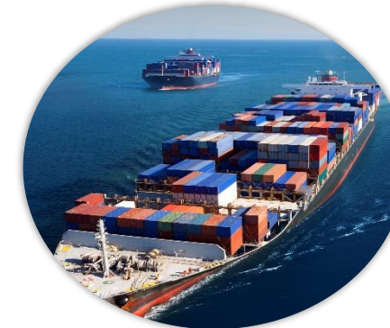
既存の製鉄、アンモニア生産と輸出実績