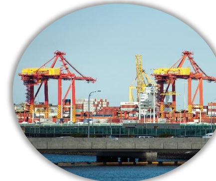
道路・鉄道・港湾・電力網にわたる充実したインフラ