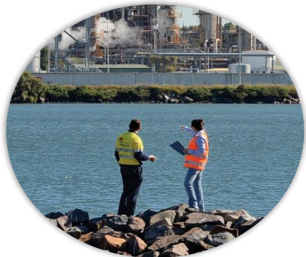
豪州最大の経済と高度な技能を備えた労働力