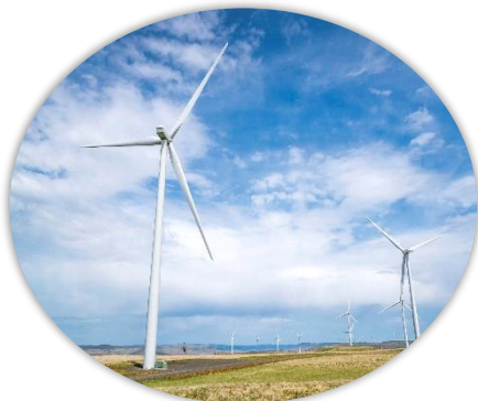
世界をリードする再エネ開発