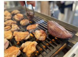
水素コンロ

屋外会場において、G7 広島サミットでも行われた水素コンロによる水素調理を実施いたします。東京食材を調理するデモを行いますので、ぜひご試食ください。