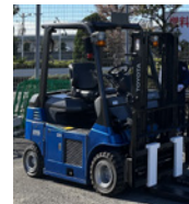
燃料電池フォークリフト

都が実施する「燃料電池フォークリフトマッチング導入支援事業」のトライアル利用現場へのバスツアーを開催します。会場まで水素で動くバスで移動し、事業の説明や充填の様子をご見学いただけます。